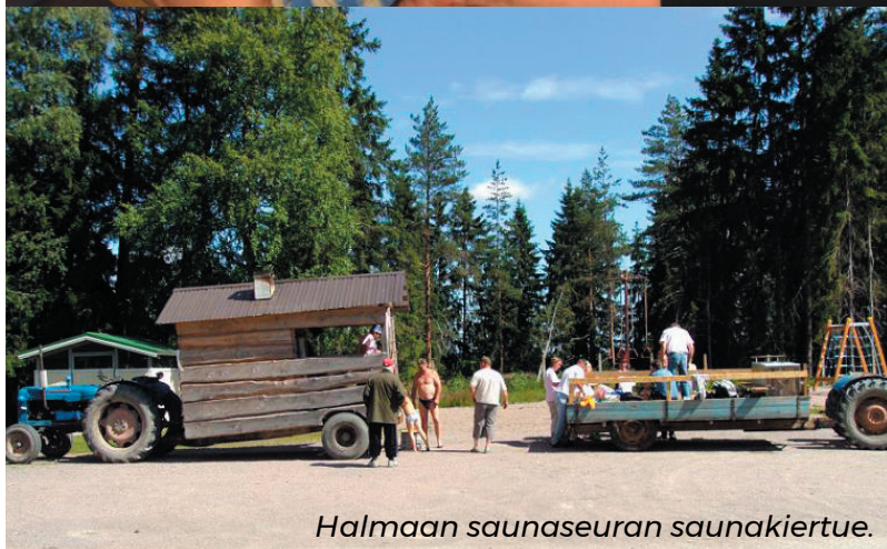
Halmaan saunaseuran saunakiertue.